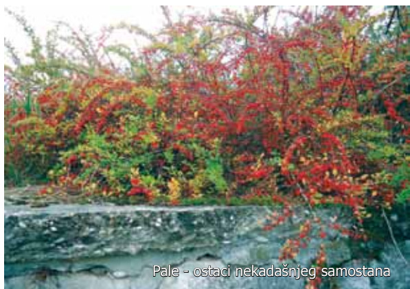
Pale - ostaci nekadašnjeg samostana

Neposredno pred samu smrt, prije smrtonosnih uboda noževima pod prozorima vojarne, svaka pojedina sestra učinila je na sebi znak križa, kako je prema izjavi jednog ranjenog vojnika očevica zapisano u Kronici sestara. Kad je molitva utihnula na njihovim usnama i kad je sve već (iz)rečeno, preostalo im je još samo rukom