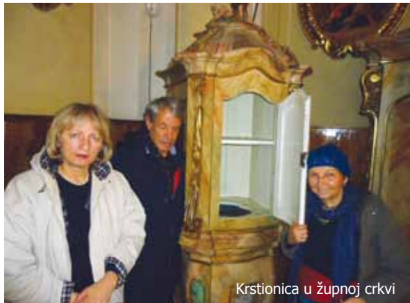
Krstionica u župnoj crkvi