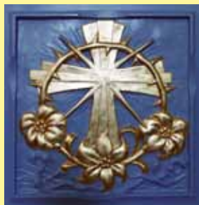
Detalj iz crkve Kraljice sv. krunice u Sarajevu