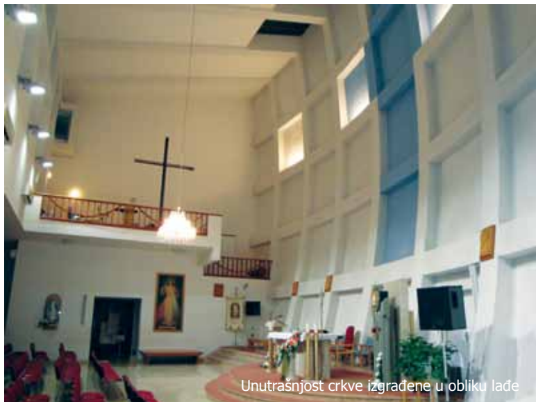
Unutrašnjost crkve izgrađene u obliku lađe