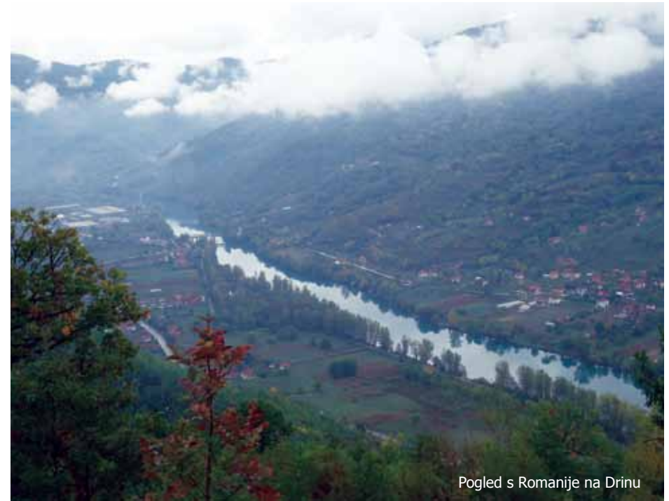
Pogled s Romanije na Drinu

Prošli smo kroz selo Bare, u kojemu su sestre provele zadnju noć prije silaska u Goražde. Zaustavili smo se na vrhuncu planine, zamišljamo zimu, snijeg i kolonu koja se probija preko ovoga prijevoja. Dolazimo do Bijele Vode odakle počinje spuštanje. Ispod nas se nalaze Osječani, Dešava, Jabuka, mjesta kojima su prolazile Blažene sestre. A cesta „prije Goražda