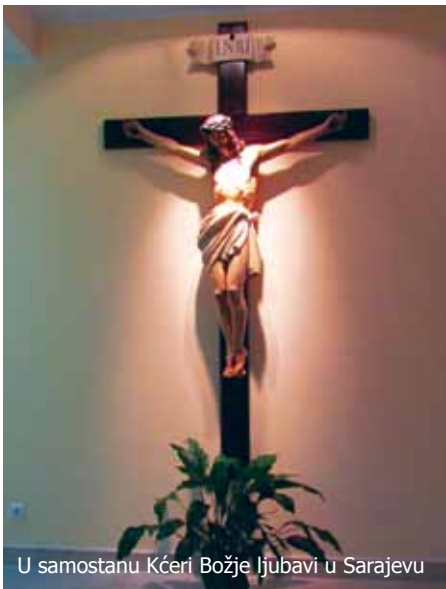
U samostanu Kćeri Božje Ljubavi u Sarajevu

Moli kajući se , priznajući se uvijek ispočetka slabim i grješnim, neotpornim na zarazu grijeha i na inteligenciju