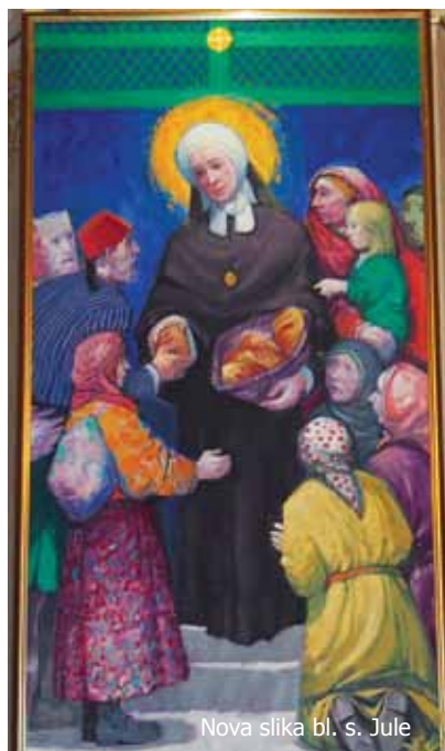
Nova slika bl. s. Jule

šestorice svećenika, zahvalili smo Bogu za živote Blaženica, za primjere svetosti koji i danas snažno govore i upućuju k Njemu. Tom prigodom pročitana je i Biskupova poruka. Na početku mise blagoslovljena je nova slika bl. s. Jule, rad akademskog slikara Tihomira Lončara iz Zagreba. Mons. Devčić je u propovijedi naglasio velikodušnost sestara i njihovu spremnost da pomognu svakome tko je pokucao na njihova vrata. Njihove živote moramo promatrati kao dar Providnosti Crkvi, Družbi i narodima iz kojih dolaze i kojima su služile.